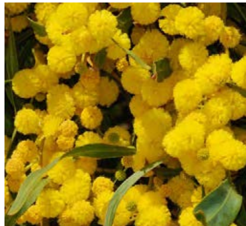
Charakteristischer Blütenstand