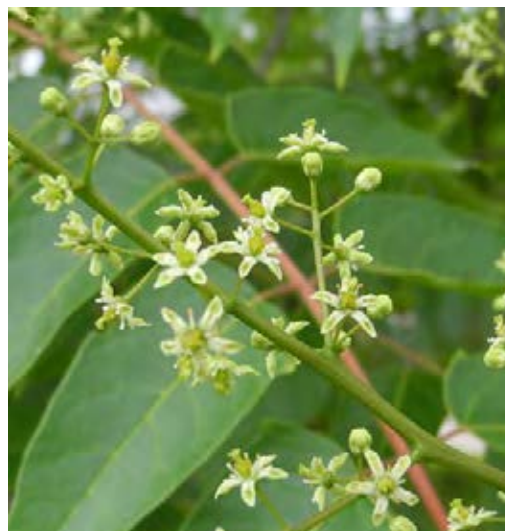
Blüten in Rispen

Quellen: Nehring et al. 2013; Schmiedel et al. 2015; www.infoflora.ch