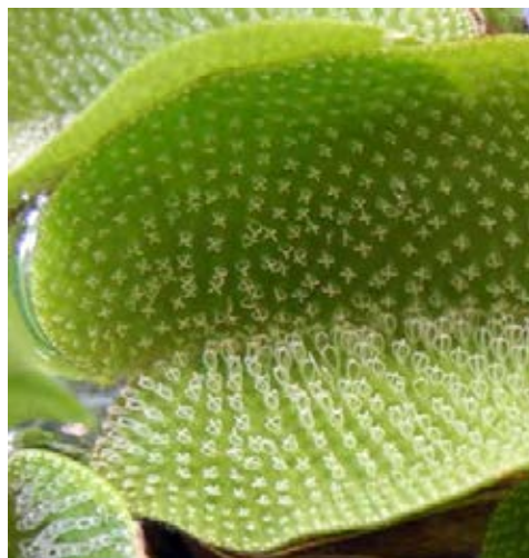
Haare am Ende verbunden