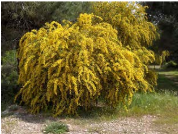
Strauch in Blüte