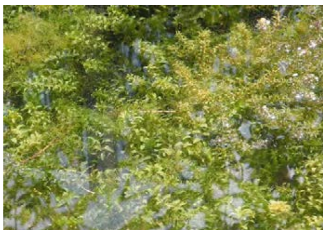
Massenentwicklung in Tümpel

Abdecken, Ausreißen, Trockenfallenlassen, Förderung von beschattenden Gehölzen an Gewässerrändern.