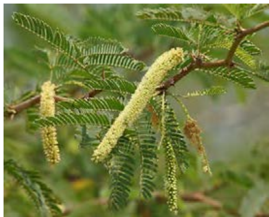
Wuchsform zwischen Strauch und Baum