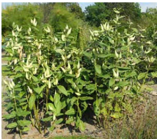
Strauch mit Ausläufern