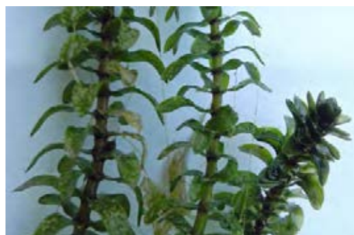
Charakteristische Sprosse mit gekrümmten Blättern (© S. Nehring)

Quellen: Nehring et al. 2013; Schmiedel et al. 2015