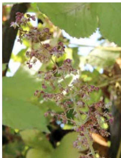
Männliche Blüten