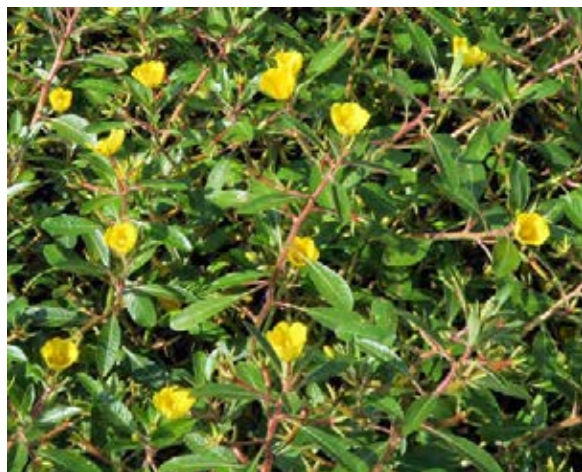
Charakteristisches Wuchsbild

Abfischen, Ausreißen, Mahd, Förderung von beschattenden Gehölzen an Gewässerrändern.