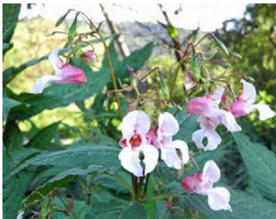
Charakteristische Blätter und Blüten

Quellen: Nehring et al. 2013; Schmiedel et al. 2015; www.infoflora.ch