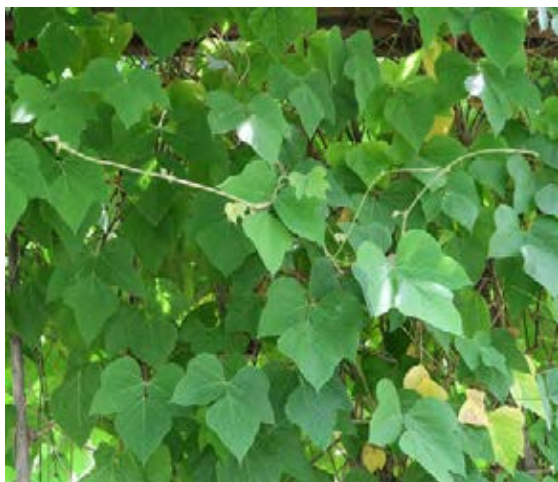
Schnell wachsende Liane

Abdecken, Abflammen, Ausgraben, Beweiden, Mahd.