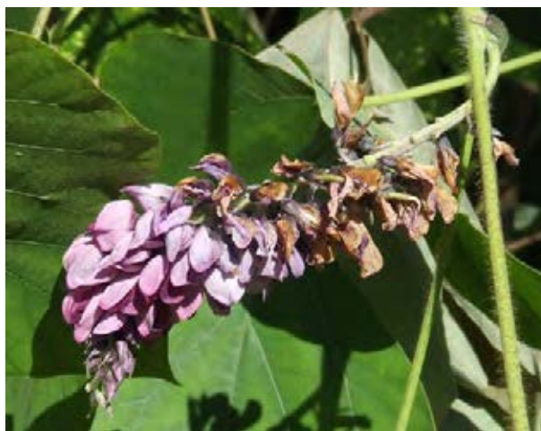
Behaarte Triebe und Traubenblüten

Quellen: EPPO 2007; Rabitsch et al. 2013; Schmiedel et al. 2015; www.infoflora.ch