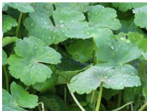
Unregelmäßig gekerbte Blätter

Quellen: Kassermann 2010; Nehring et al. 2013; Pieret & Delbart 2009; Schmiedel et al. 2015