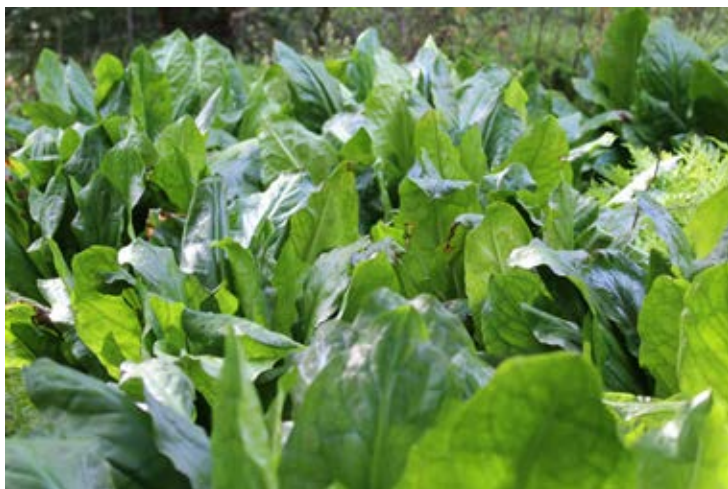
Massenbestand an kleinem Fließgewässer

Beseitigungs-/Kontrollmaßnahmen: Ausgraben, Ausreißen, Abschneiden der Kolben.