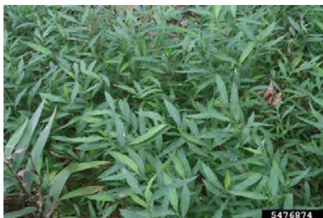
Massenbestand

Beseitigungs-/Kontrollmaßnahmen: Ausreißen, Beweiden, Mähen.