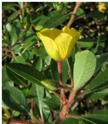
Dunkelgrüne stumpfe Blätter und kleine Blüte

Quellen: Pieret & Delbart 2009; Rabitsch et al. 2013; Schmiedel et al. 2015