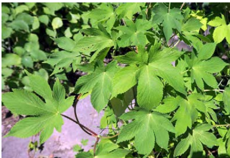
Schnellwachsende Schlingpflanze

Beseitigungs-/Kontrollmaßnahmen: Ausgraben.