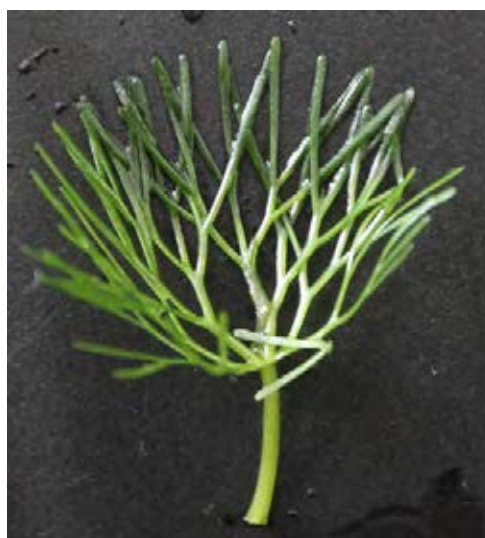
Blatt mit mehrfach gegabelten Blattabschnitten

Quellen: CABI 2015; Hussner et al. 2010; Kassermann 2010; Van Oosterhout 2009