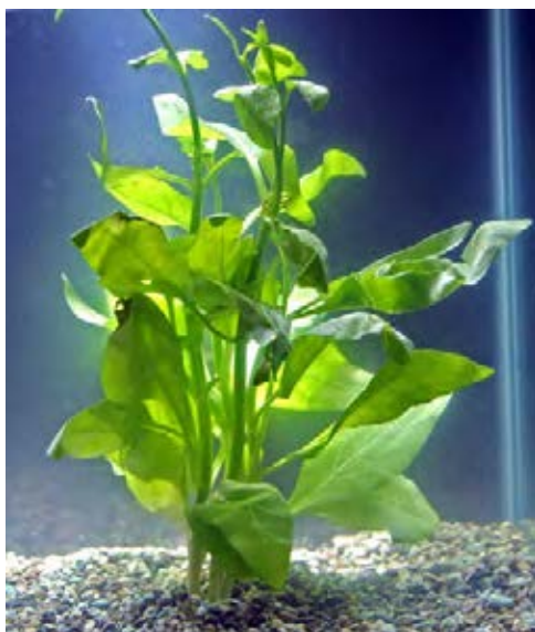
Habitus mit ganzrandigen Blättern

Beseitigungs-/Kontrollmaßnahmen: Ausreißen, Mahd, Trockenfallenlassen.