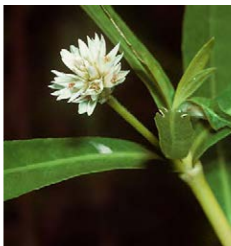
Charakteristischer Blütenstand

Quellen: EPPO 2015, 2016; Rabitsch et al. 2013