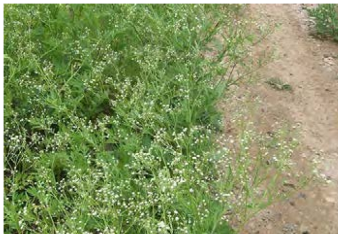
Bestand am Wegesrand (© Ecu)

Beseitigungs-/Kontrollmaßnahmen: Ausreißen, Mahd, Pflügen.