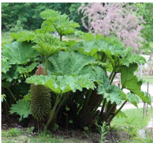
Staude mit Blättern und Blütenstand