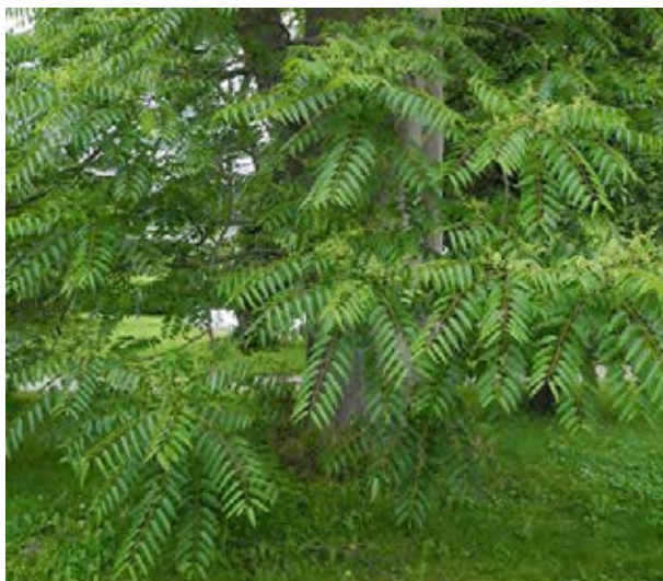
Baum mit unpaarig gefiederten Blätter (© S. Nehring)

Beseitigungs-/Kontrollmaßnahmen: Ausgraben, Ausreißen, Fällung mit Beweidung, Mahd, Ringelung.