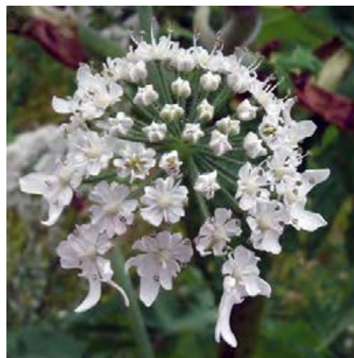
Mehrstängelige Pflanze