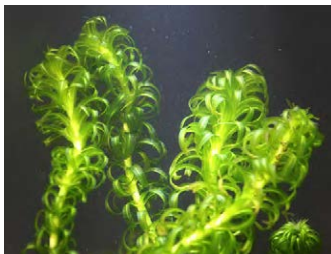
Sprosse mit stark gekrümmten Blättern

Abdecken, Ausreißen, Mahd, Förderung von beschattenden Gehölzen an Gewässerrändern.