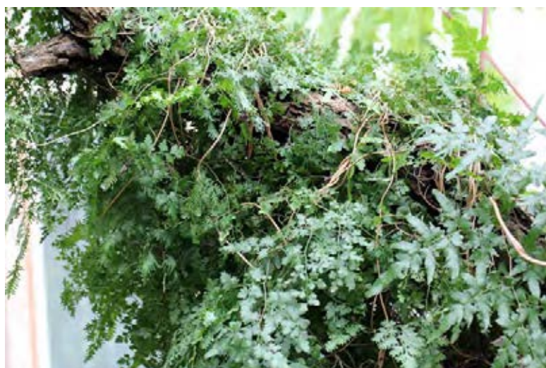
Kletterfarn bildet dichte Matten

Beseitigungs-/Kontrollmaßnahmen: Ausgraben, Ausreißen.