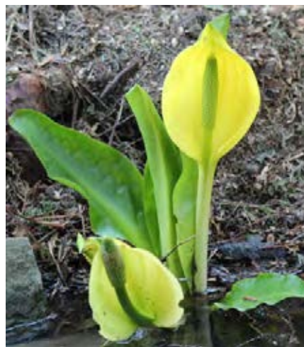
Kolben mit gelben Hochblatt

Quellen: Nehring et al. 2013; Pieret & Delbart 2009; Schmiedel et al. 2015; www.inflora.ch