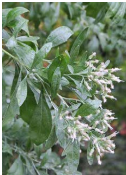
Strauch mit mehreren Stämmen (© S. Nehring) Charakteristische Blätter und Blüten (© S. Nehring)

Quellen: EPPO 2014; Rabitsch et al. 2013; Schmiedel et al. 2015