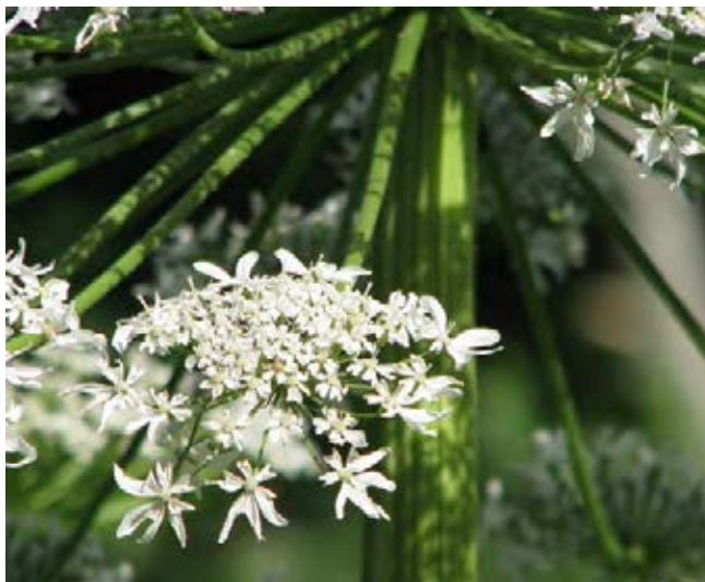
Gefurchter, spärlich behaarter Stängel und weiße, manchmal violette Blüten

Quellen: Kabuce & Priede 2010; Nielsen et al. 2005; Rabitsch et al. 2013; Schmiedel et al. 2015