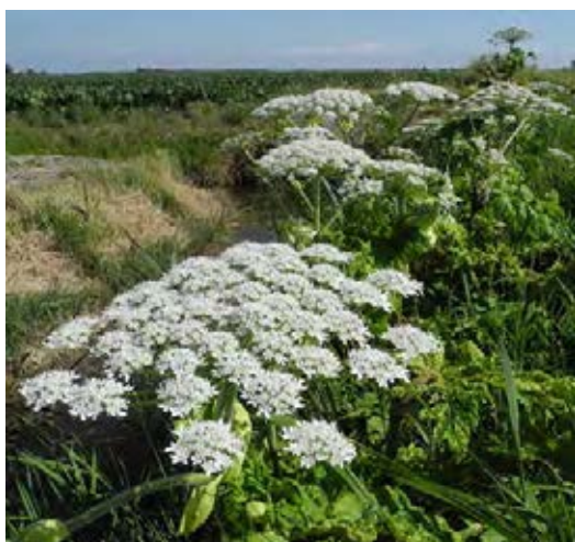
Mehrere Pflanzen in Blüte

Abstechen, Ausgraben, Beweiden, Fräsen, Pflügen, Mahd.