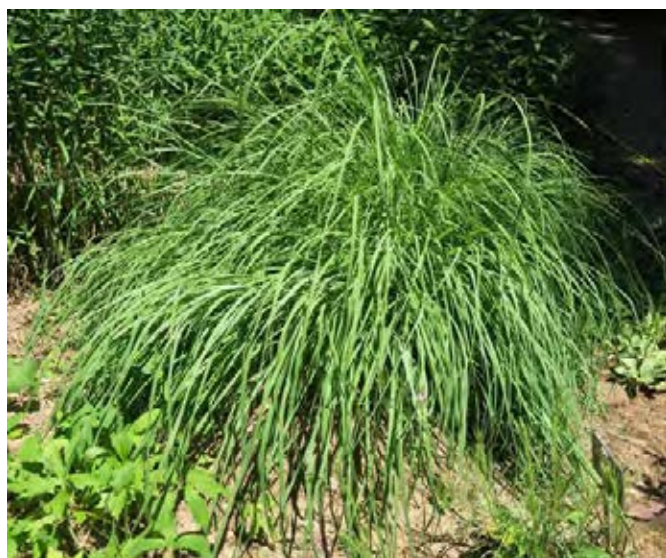
Sommergrünes Gras

Beseitigungs-/Kontrollmaßnahmen: Ausreißen, Beweidung, Mahd.