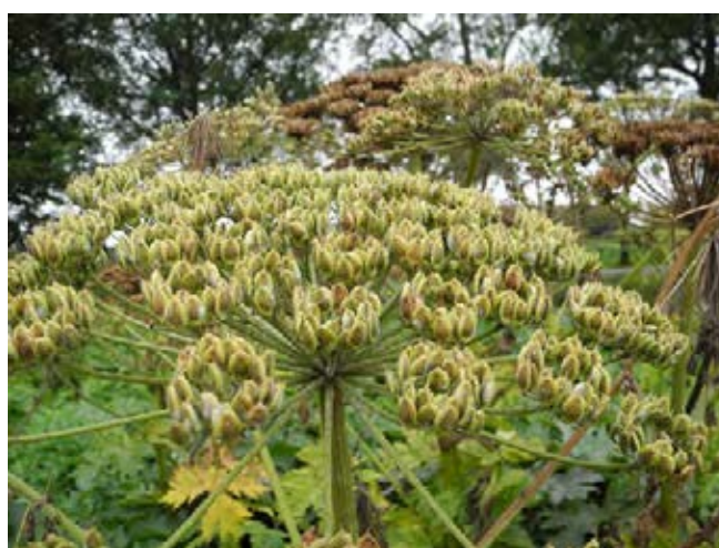
Langsam braun werdende Früchte

Quellen: Nehring et al. 2013; Nielsen et al. 2005; Schmiedel et al. 2015