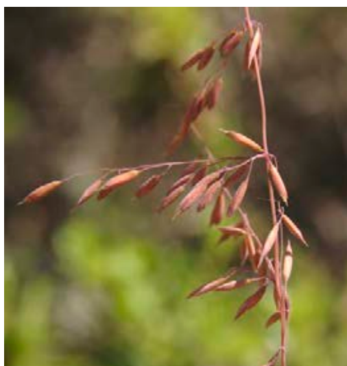
Pflanzenhorst mit Rispen