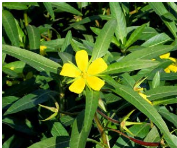
Großer Bestand in einem Altarm (© S. Nehring) Hellgrüne spitze Blätter und große Blüte (© S. Nehring)

Quellen: Nehring et al. 2013; Pieret & Delbart 2009; Schmiedel et al. 2015