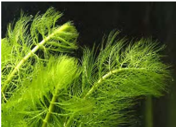
Gefiederte Stängel unter Wasser

Ausreißen, Ausspülen, Mahd, Förderung von beschattenden Gehölzen an Gewässerrändern.