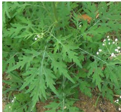
Fiederspaltige Blätter und kleine Blüten (© Ecu)

Quellen: CABI 2015; EPPO 2014; http://de.hortipedia.com