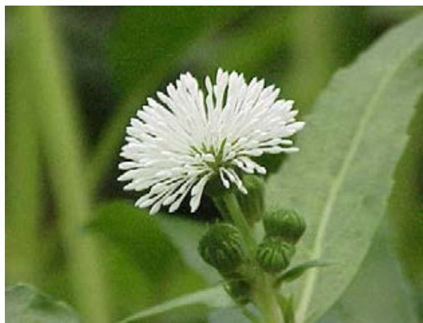
Röhrenblüte und fein gezahnte Blätter

Quellen: CABI 2019; EPPO 2017; Kasselman 2010