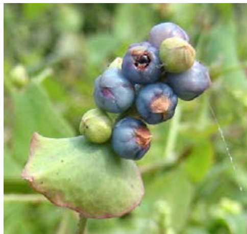
Metallic-blaue Früchte

Quellen: CABI 2015; Oliver & Coile 1994; Rabitsch et al. 2013; Schmiedel et al. 2015