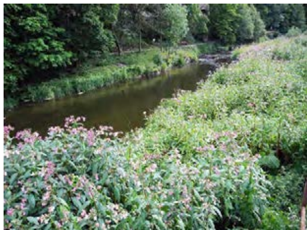
Massenbestand am Flussufer