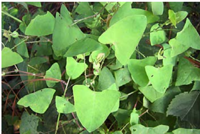
Liane mit dreieckigen Blättern

Beseitigungs-/Kontrollmaßnahmen: Ausreißen, Mahd.