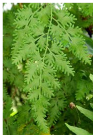
Fruchtbarkeitsblätter mit Sporangien