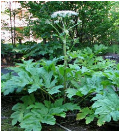
Blätter weniger stark geteilt

Beseitigungs-/Kontrollmaßnahmen: Abstechen, Ausgraben, Beweiden, Fräsen, Pflügen, Mahd.