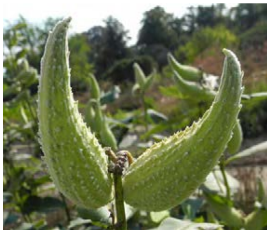
Charakteristische Balgfrüchte (© S. Nehring)

Quellen: Nehring et al. 2013; www.infoflora.ch